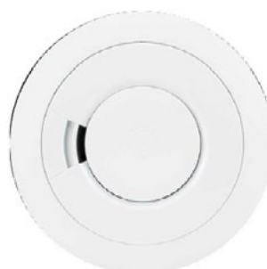
CO8MS Détecteur de monoxyde de carbone sans fil