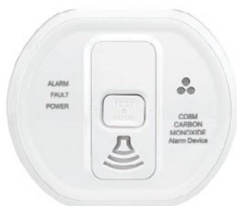
DFS8MS Détecteur de fumée sans fil

Le son de l'alarme provenant du détecteur de fumée ou de monoxyde de carbone peut uniquement être arrêté sur place en pressant le bouton du détecteur comme indiqué ci-dessous, sans quoi l'alarme continuera de sonner pour une durée de 300 secondes.